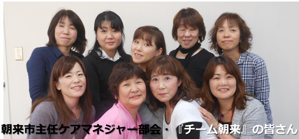
朝来市主任ケアマネジャー部会・『チーム朝来』の皆さん

「よい支援を受けた援助者は、よい支援が提供できる」ケアマネジメント支援会議をモデル実践します。援助者を大切に育む『朝来スピリッツ』を、是非体感してください。